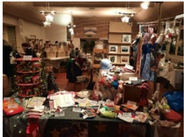
Weihnachtsverkauf Abtwil 27. 11. 22