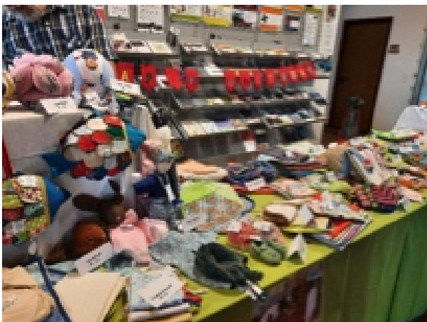
Verkauf Birr 26. 06. 22