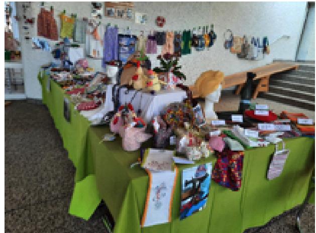
Suppentagsverkauf Engelburg 20. 03. 22